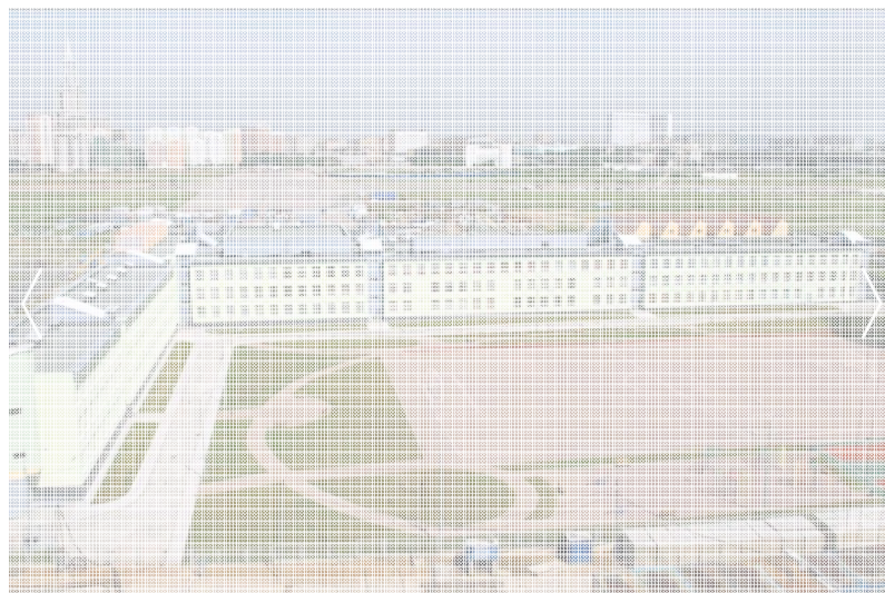
Рис. 6. Экспериментальная школа на Ходыньском поле, Москва

способствующие эстетическому воспитанию детей и подростков, рекреационные зоны активного и тихого отдыха, на которых могут проводиться занятия на открытом воздухе в теплый период года. Разносторонне оснащенная, организованная территория школ способствует дополнительной мотивации к обучению, развитию внимательного отношения к природе и дает дополнительный эмоциональный заряд у детей, чему не может способствовать безликая, однородная среда.