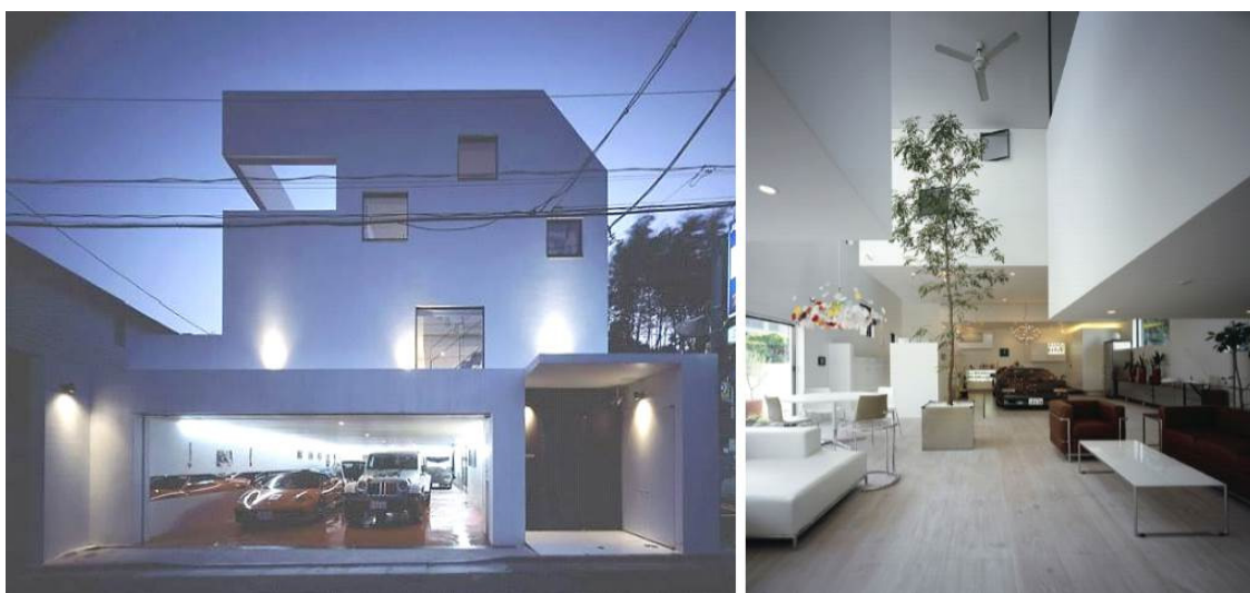
Рис. 3. Дом-автосалон и большое дерево в центре гостиной, арх. Takaya Tsuchida