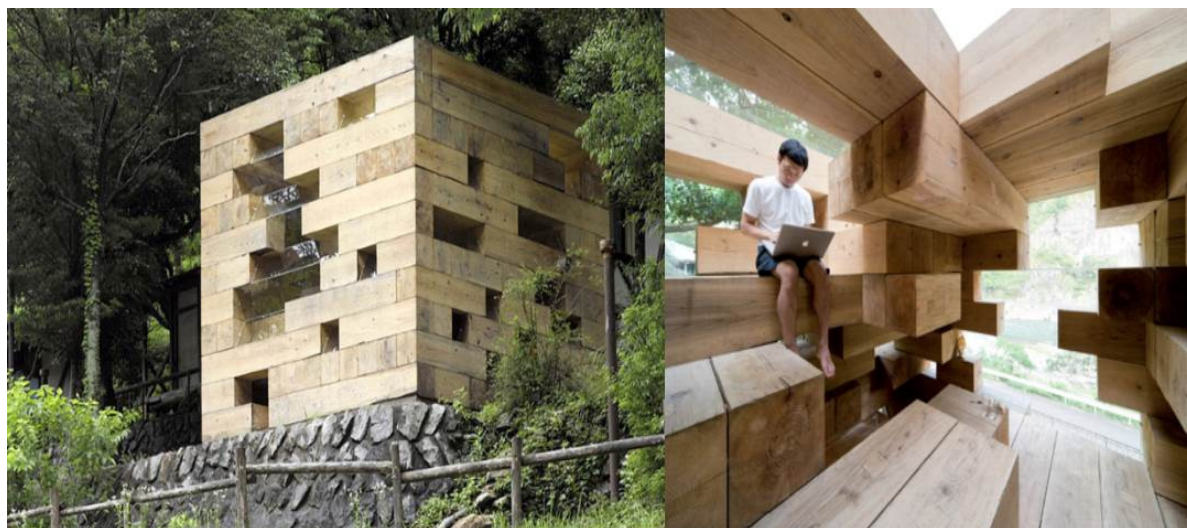
Рис. 2. Деревянный дом Final Wooden House, Кумамото, Япония

ный проект креативного архитектора Су Фудзимото визуально демонстрирует универсальность и практичность древесины как отделочного и строительного материала. При первом рассмотрении кажется будто дом абсолютно не эффективен и, скорее похож на домик из детства, однако он полностью пригоден для проживания. Необычная конструкция сооружения состоит из эргономичных объемов и модулей – деревянных блоков, умело интегрированных в пространстве, что обеспечивает комфорт и уют. Они одновременно выполняют несколько функций: служат не толь мебелью, но и основополагающими дома [3].