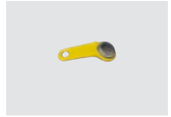
Optional: On/Off user key