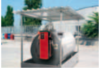
Direct on the tank application