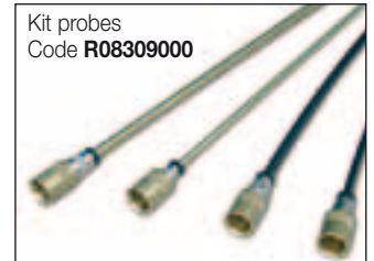
Kit probes Code R08309000