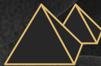
ПИРАМИДА В ГИЗЕ