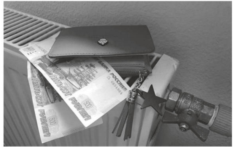
Республиканский тариф на тепло вернут на уровень среднего по ЮФО.

— Мы должны признать, что тарифы в сфере теплоснабжения в Республике Крым выше, чем в других субъектах ЮФО. Принято решение, и на этапе подписания находится поручение, которым с 1 сентября текущего года планируется снизить планку предельного тарифа на тепловую энергию с 3 тысяч до 2300 (вместе с НДС. — Ред. ). Это приблизительно соответствует и