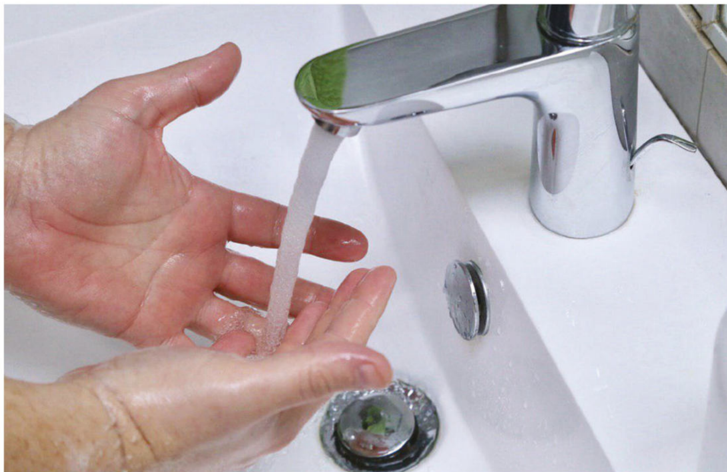
Север Крыма обеспечат качественной водой к 2023 году.

В Крыму, на базе отделений гастроэнтерологии и колопроктологии Республиканской клинической больницы им. Семашко, планируется открыть Центр воспалительных заболеваний кишечника. Об этом сообщила пресс-служба Минздрава республики. Над подготовкой к созданию нового медцентра будет работать комиссия по лечению пациентов с хроническими воспалительными заболеваниями кишечника, созданная при крымском Минздраве.