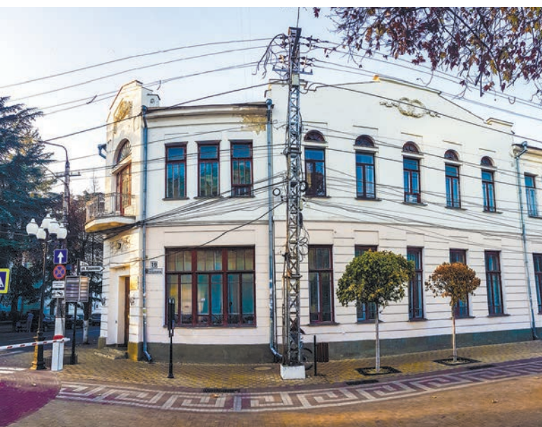
Старинное представительное здание в центре Симферополя – бывший Дом политпросвещения – помнит скандальную презентацию «космопоэмы» Щипачёва «Гимн вечности».

“ В СИМФЕРОПОЛЕ БЫЛА НАПЕЧАТАНА ПЕРВАЯ ЕГО КНИГА. ТОНЕНЬКИЙ, В 15 СТРАНИЧЕК, СБОРНИК «ПО КУРГАНАМ ВЕКОВ» ПЕРЕПОЛНЯЛА «КОСМОРИТОРИКА»: «И ПО-ПРЕЖНЕМУ В ШАР ЗЕМНОЙ МОЙ КОНЬ БУДЕТ БИТЬ КОПЫТОМ»