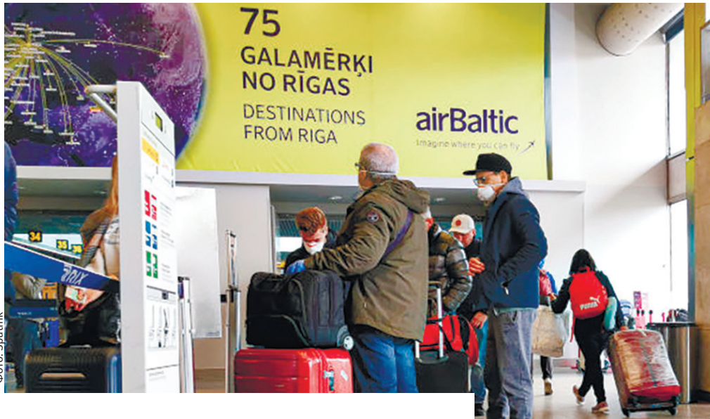
Тысячи россиян оказались перед угрозой выдворения из Латвии.

При этом 789 человек из указанного числа – старше 60 лет. В ведомстве также уточнили, что около полови-