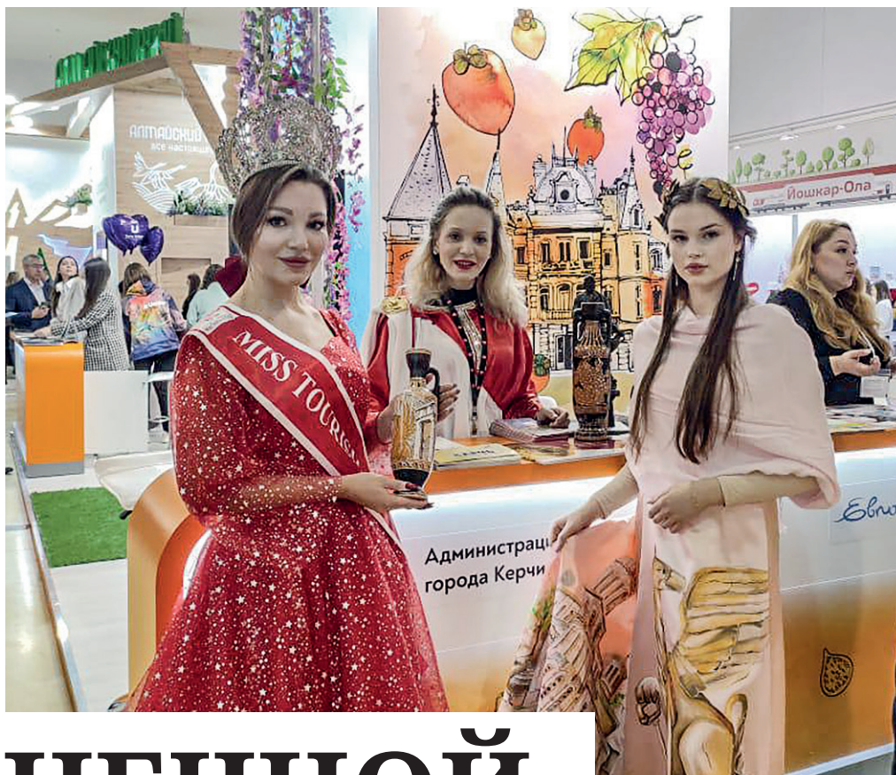
Крым представил возможности отдыха в республике на крупнейшей Международной турвыставке «Интурмаркет» в Москве.

Преображение наших курортов после Крымской