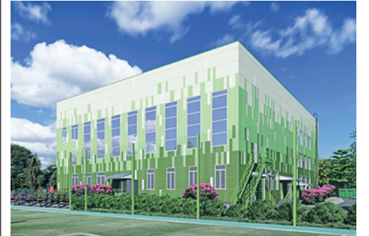
Проект нового блока школы им. Святителя Луки Крымского.

– Сдать в эксплуатацию новое здание планируется к концу 2024 года, – сообщил Глава Крыма Сергей Аксёнов в своём телеграм-канале.