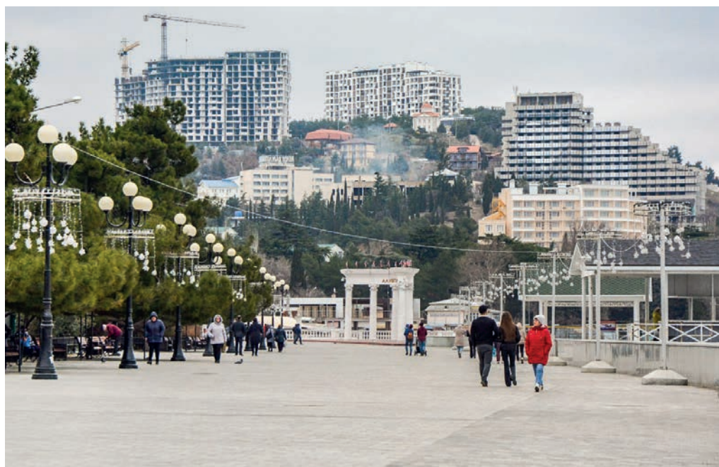
И сегодня на набережной Алушты немало туристов.