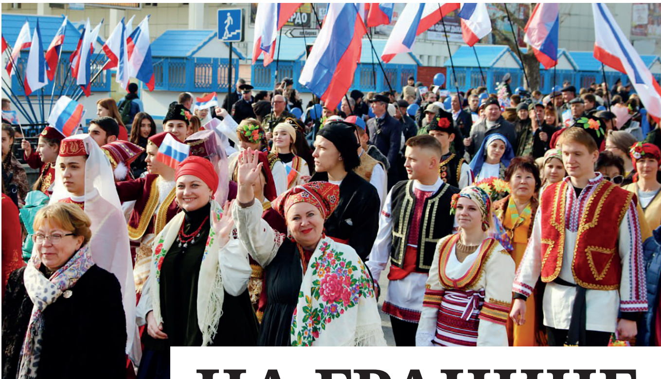
Девять лет назад крымчане себе и миру дали однозначный ответ на вопрос, чей Крым.