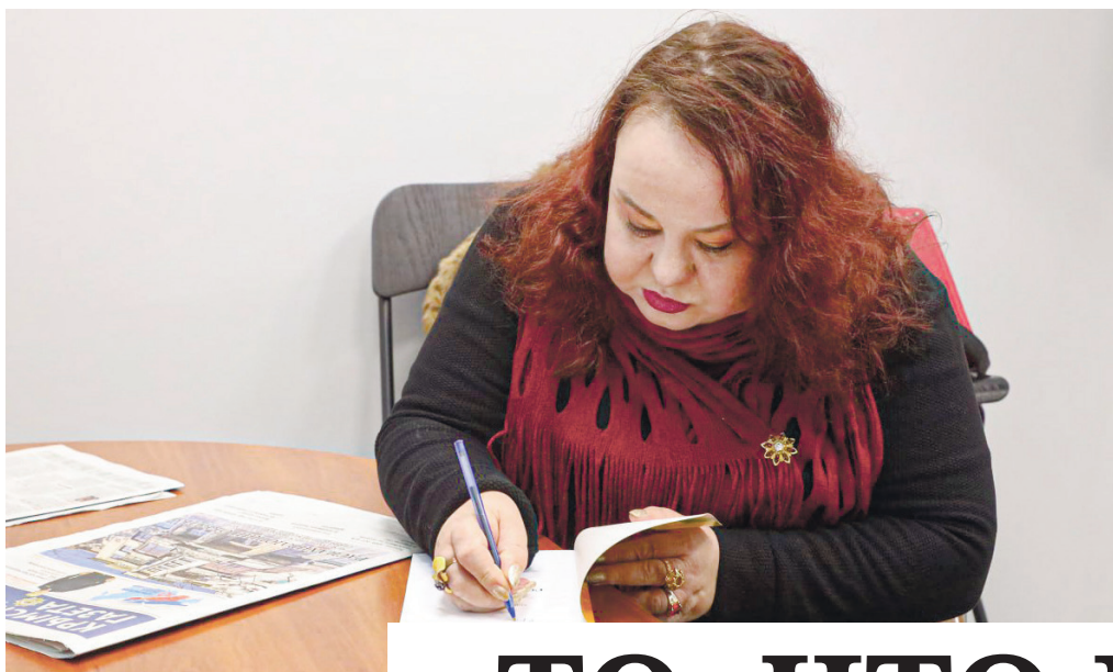
Фото: Михаил ГЛАДЧУК