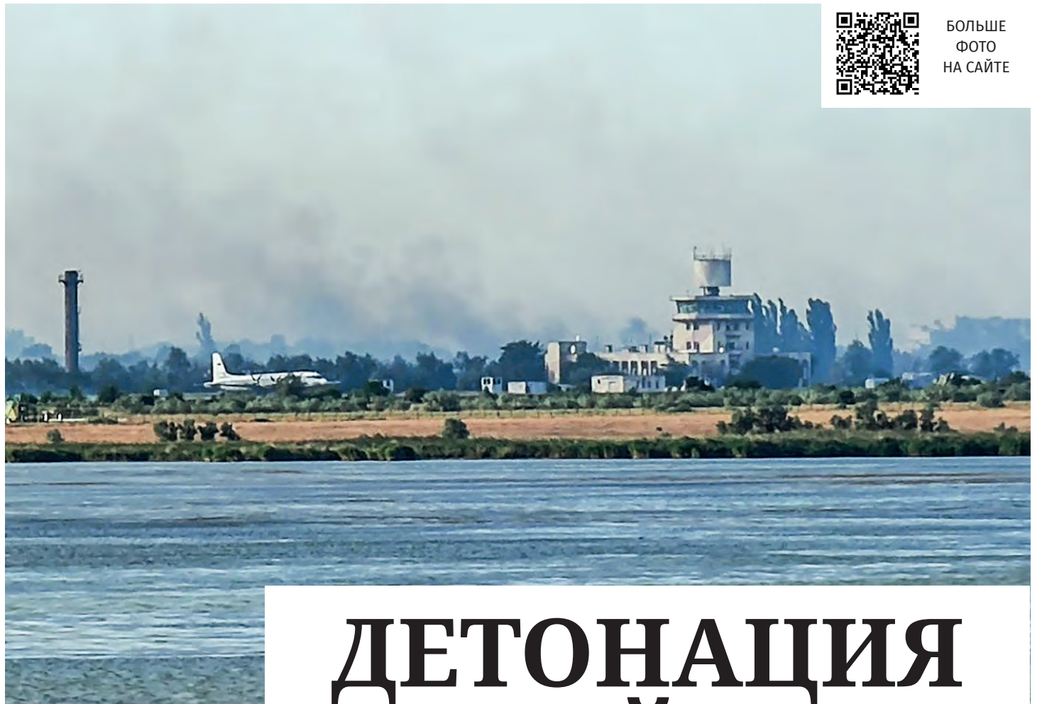
Новофёдоровка, 9 августа. 18:36. Аэродром в рабочем состоянии.

Председатель Совета министров РК Юрий ГОЦАНЮК. Строительство новой объездной Симферополя на участке Донское – Перевальное у трассы «Таврида» прекратят на время курортного сезона.