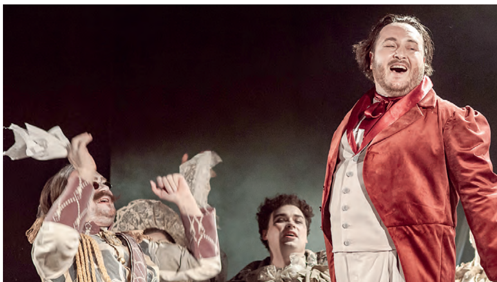
С успехом представив в прошлом сезоне гоголевские «Мёртвые души», в новом Крымский ТЮЗ сохранит равнение на классику.

– Перед спектаклем «Евпатория, я люблю тебя» мы будем рассказывать детям о театре и его особенностях, а после спектакля будет клят-