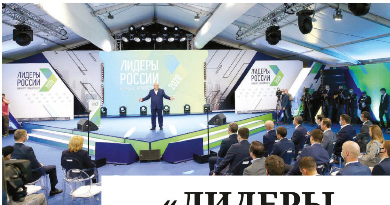
Председатель Правительства РФ Михаил Мишустин выступает перед участниками конкурса «Лидеры России».