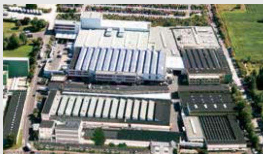
ドイツバイエルン州にあるヴァレーマ社の本社工場

日射遮蔽分野で世界をリードする ヴァレーマ社の製品は、 世界中で広く愛用されています。