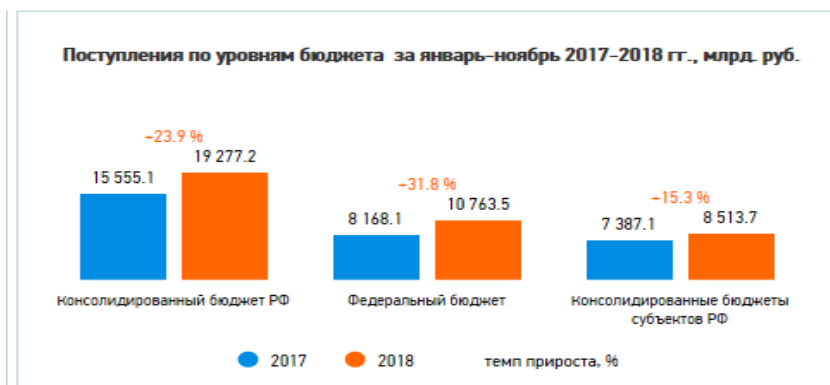
Рис.1.1 Поступление налогов по уровням бюджетной системы за 2017-2018гг. 1

Если графический материал является авторской разработкой, то это необходимо отметить.