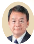
公益社団法人さいたま観光国際協会 名誉会長 さいたま市長