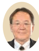
公益社団法人さいたま観光国際協会 会長