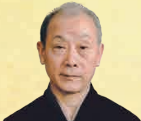
ほんだ みつひろ 本田 光洋

シテ方金春流。 父、七十九世故金春信高に師事。学習院大学国文学科卒業。重要無形文化財総合指定保持者。(公社)金春円満井会顧問。(一社)日本能楽会理事。 平成29年4月、宗家を長男金春憲和に譲る。 6歳で初舞台。10歳のとき「狸々」にて初シテ。現在までに「翁」「獅子」「乱」「道成寺」「鷲」「卒都婆小町」「伯母捨」「関寺小町」を抜く。 平成19年11月、北京、上海、重慶にて講座。