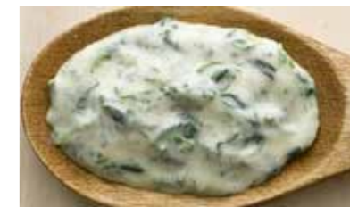
Соус Шпинат Альфредо