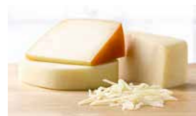
Смесь трех сыров