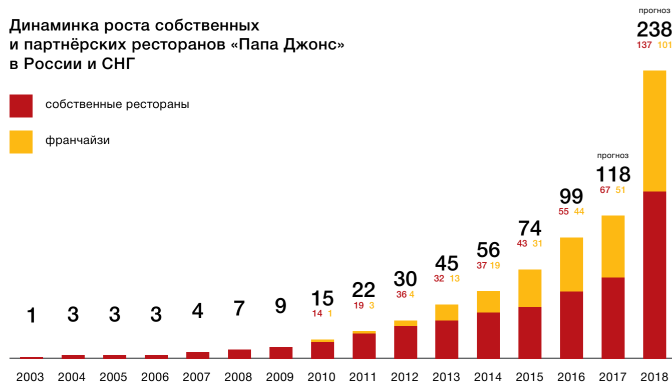
Динамика роста собственных и партнёрских ресторанов «Папа Джонс» в России и СНГ