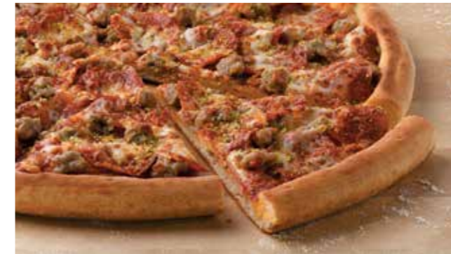
Любимая Пицца Джона

20 различных видов пиццы, а также разнообразные закуски, салаты, десерты и напитки