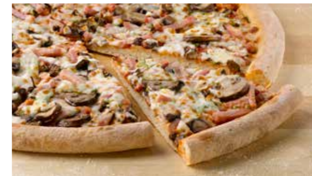
Ветчина и Грибы