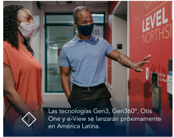
Las tecnologías Gen3, Gen360°, Otis One y e-View se lanzarán próximamente en América Latina.

Ambos sistemas se basan en el diseño y la tecnología de correa plana de la familia de ascensores Gen2 más vendida de Otis y están equipados con la solución Otis ONE™ IoT para monitorear el estado del equipo en tiempo real, las 24 horas del día, los 7 días de la semana.