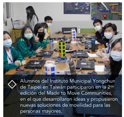
Alumnos del Instituto Municipal Yongchun de Taipei en Taiwán participaron en la 2da edición del Made to Move Communities, en el que desarrollaron ideas y propusieron nuevas soluciones de movilidad para las personas mayores.

A través de nuestro nuevo programa de Responsabilidad Social Corporativa, nuestro objetivo es inspirar a los estudiantes innovadores de todo el mundo a aplicar soluciones creativas basadas en la tecnología para eliminar los desafíos de movilidad en las comunidades desatendidas.