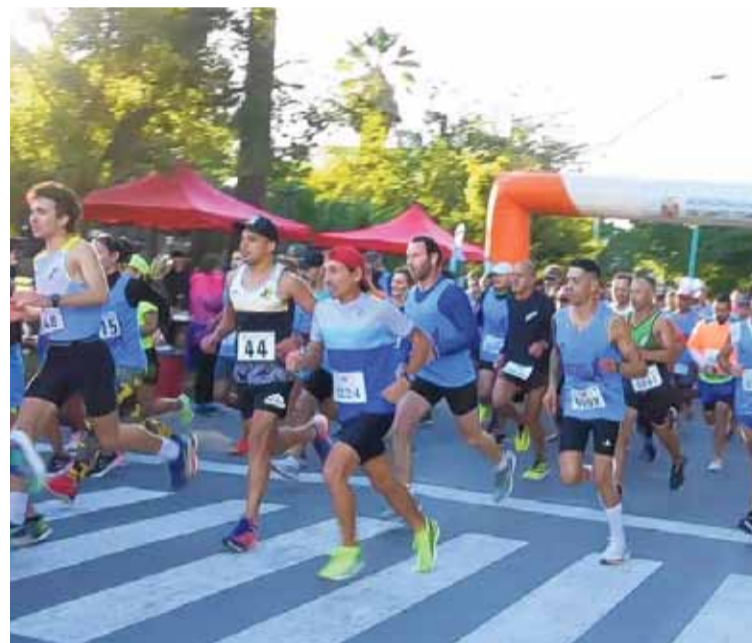
COMPETENCIA. La prueba, organizada por la Dirección de Deportes y Recreación, convocó a más de 100 atletas de la ciudad.

Tal como estaba previsto, la carrera se inició a las 8.30 horas y repartió premios de dinero en efectivo para los primeros puestos de la clasificación general y trofeos en todas las categorías.