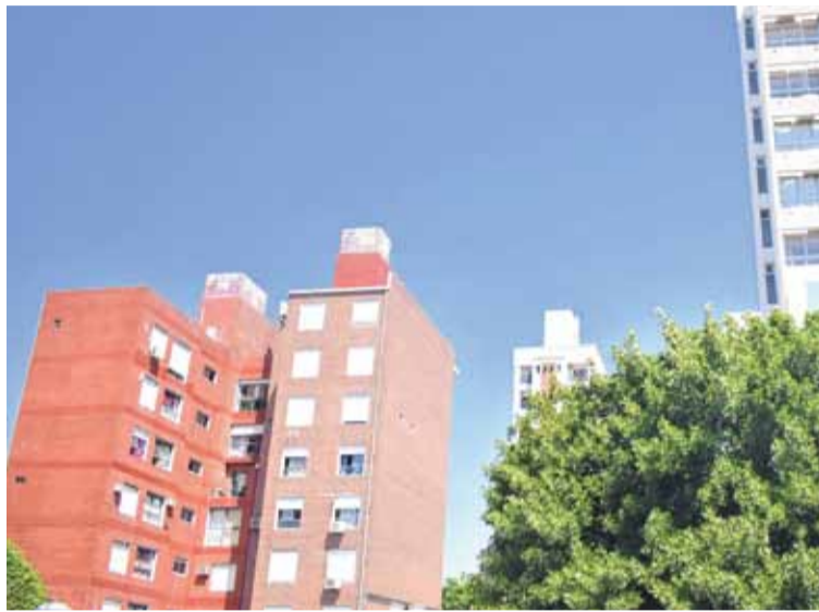
CRISIS HABITACIONAL. En el último tiempo se gestó un desfasaje entre la escasa oferta y abundante demanda de alquileres en Santa Fe.

“La actualización para los contratos vigentes de acuerdo a la Ley 27.551 se hace una vez por año, a nivel nacional, con el índice brindado por el Banco Central. Pero no