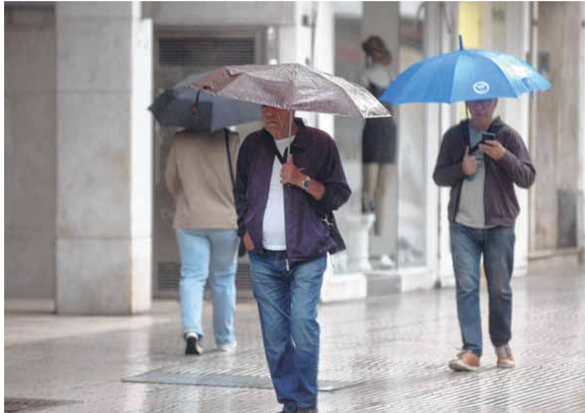
PRECIPITACIONES. Se espera que el fenómeno de El Niño traiga lluvias intensas entre agosto y febrero o marzo del 2024.

Recordó que en Perú y Ecuador hubo inundaciones en estos últimos meses, en sí todo el Pacífico sobre el norte de Sudamérica “está bastante caliente”. Lo que provoca que el propio Trópico de Capricornio genere temperaturas por encima de la media, además de que hay sistemas de baja presión muy grandes. Esto a su vez desencadena y continuará desencadenando nevadas y lluvias intensas