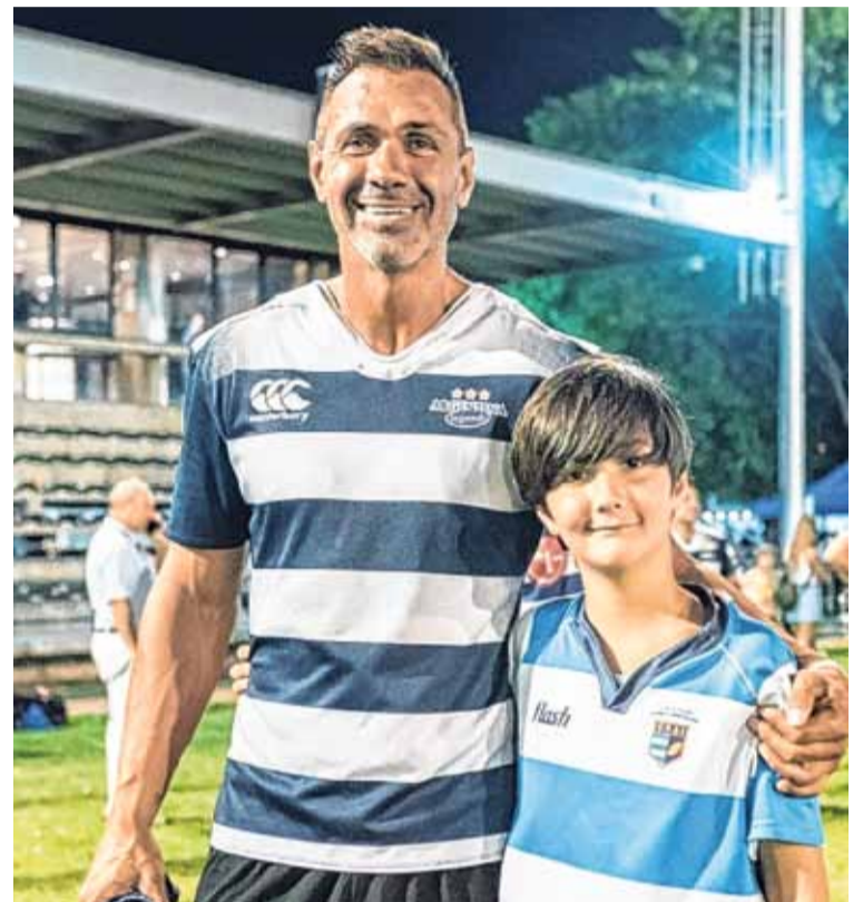
Anfitrión. Los Pumas Classic jugará un amistoso ante Invitación XV de Santa Fe en CRAI.

Uno de los referentes de la FUAR detalló que “la actividad arrancará con un encuentro de rugby infantil del que participarán CRAI, Alma Juniors, La Salle Jobson, Universitario, San Carlos RC, Pucará de Reconquista, y San Justo. Ese encuentro termina con una clínica de media hora que se dará a todos los chicos, mángers, entrenadores y el que sea. Después