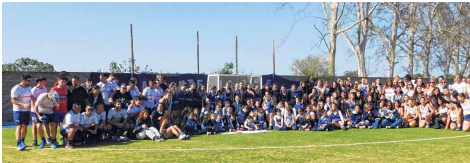
Un sueño hecho realidad. La Salle Jobson tiene su cancha de hockey sintético propia.

Lo deseado desde hace mucho tiempo, lo soñado por muchos dirigentes, técnicos, jugadores, juga-