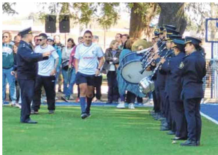
Con todo. La banda de música de la policía provincial acompañó la inauguración de la flamante cancha.