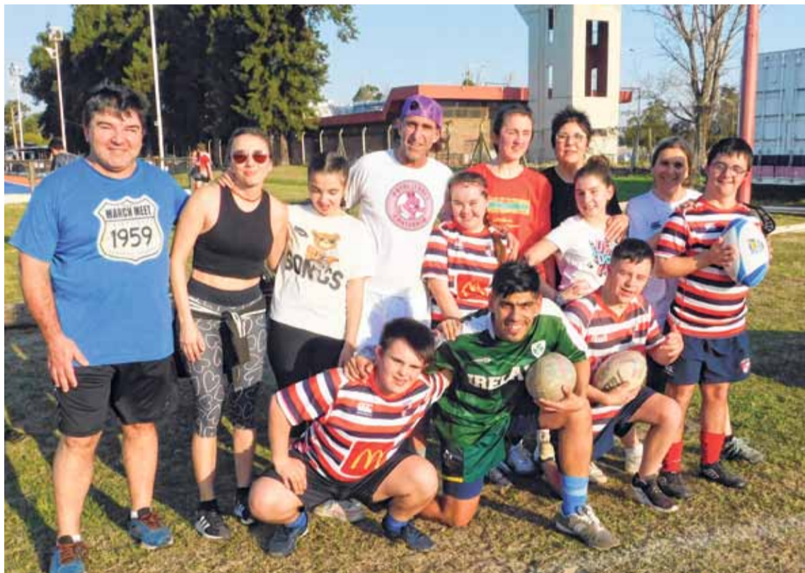
Epicentro. El predio de Santa Fe RC es el lugar para la práctica del Mixed Ability Rugby.

La psicopedagoga referenció que “la intención es que cada chico o chica que quiera empezar lo hace con las divisiones pertinentes y va subiendo, y cuando