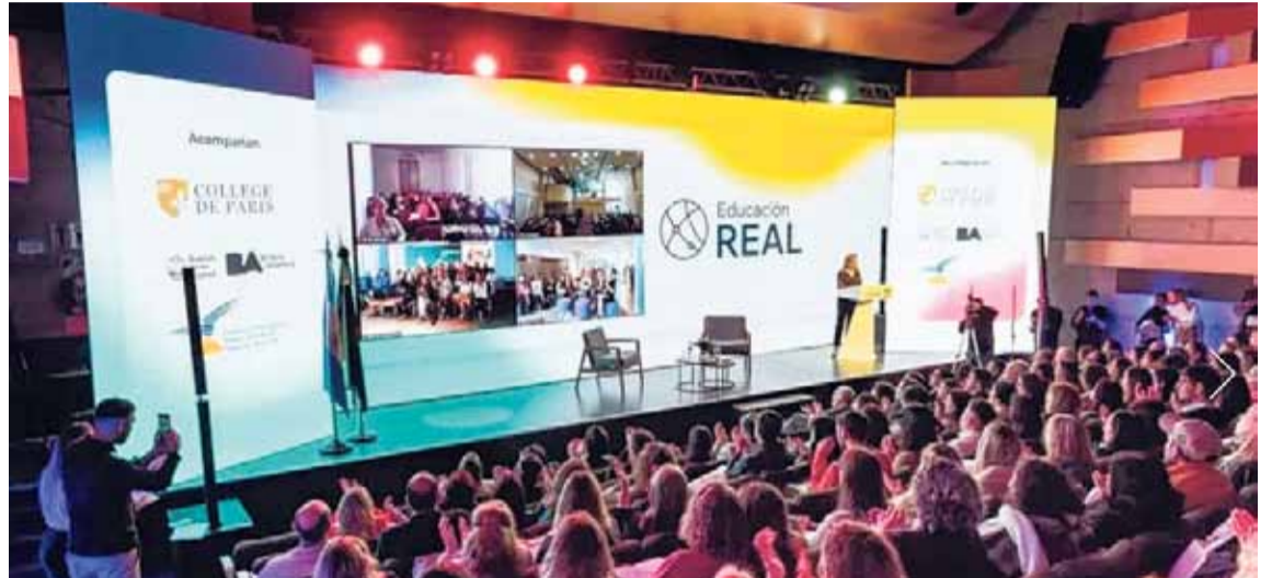
DEBATE. El Campus de la Universidad Siglo 21 fue el escenario donde especialistas nacionales e internacionales aportaron distintas miradas sobre el presente de las instituciones educativas.